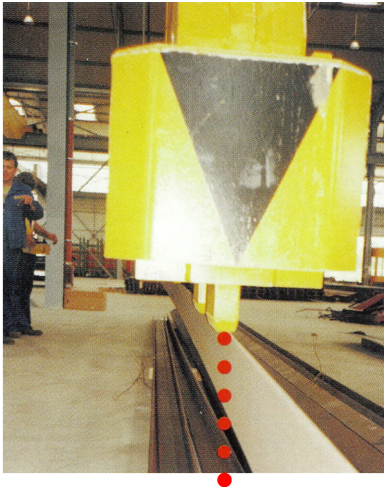
Figure 1: Schiebeanker hebt ein einzelnes Profil

Mit einem in den Magnetpol integrierten Schiebeanker lässt sich die Polfläche automatisch der zu hebenden Last optimal anpassen. Bei ausgefahrenem Schiebeanker lassen sich leicht einzelne Stäbe oder Kleinmengen kommissionieren.