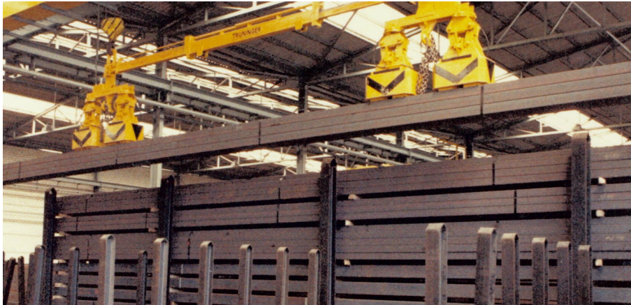
Figure 2: Einlagern der Bunde in ein Rungenlager