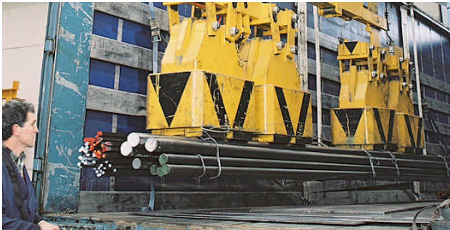
Figure 1: LKW-Entladung der Stabstahlbunde

Richtig geführte Magnete erlauben, die Last schnell und zuverlässig anzufahren, zu greifen, in wenigen Sekunden vom Lastwagen abzuheben und zum Lagerplatz zu transportieren.