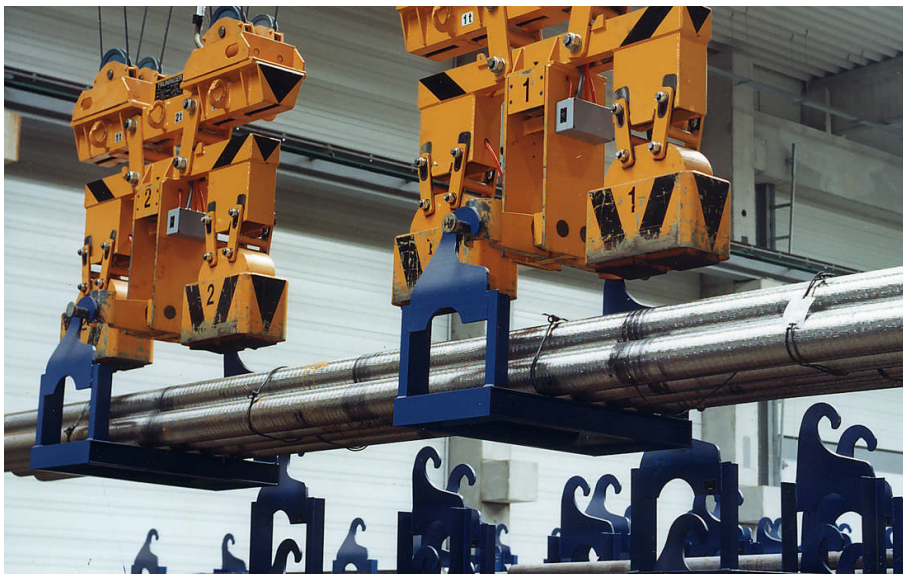
Figure 3: Rundstahltransport in Stapeljochen

In die Magnetanlage integrierte Jochträger ermöglichen mit derselben Anlage das schnelle Einlagern der Bunde in die Joche, deren einfache mechanische Umstapelung sowie das gezielte magnetische Kommissionieren von Einzelmaterial. Auf diese Weise kann ein stark diversifiziertes Lager effizient bewirtschaftet werden. Mehr Informationen zu Stapeljochtransport finden Sie auf der TRUNINGER Webpage.